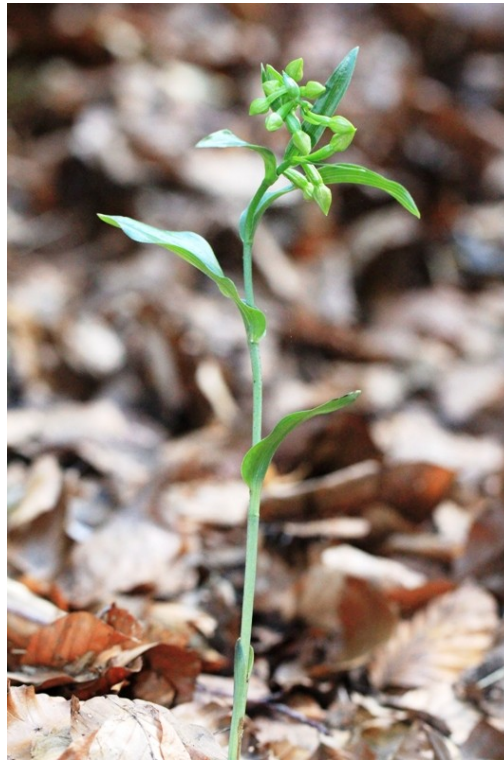
Figura 2: Epipactis exilis , espècie poc freqüent amb noves citacions realitzades aquest any.