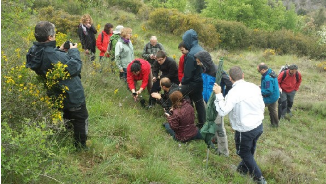
Figura 3: Explicació, fotografia i citació d'orquídies durant la sortida naturalista divulgativa anual.

Finalment s'ha penjat on-line i ja és consultable el mapa interactiu amb la distribució de tots els tàxons d'orquídies d'Osona, creat a partir de la base de dades del projectes. També permet consultar el nombre de citacions i de tàxons a cada quadrícula de 5x5 km i obtenir informació del nombre de citacions de cada tàxon que s'hi han fet. El mapa es pot consultar a l'adreça http://mapa-orquidies.gno.cat .