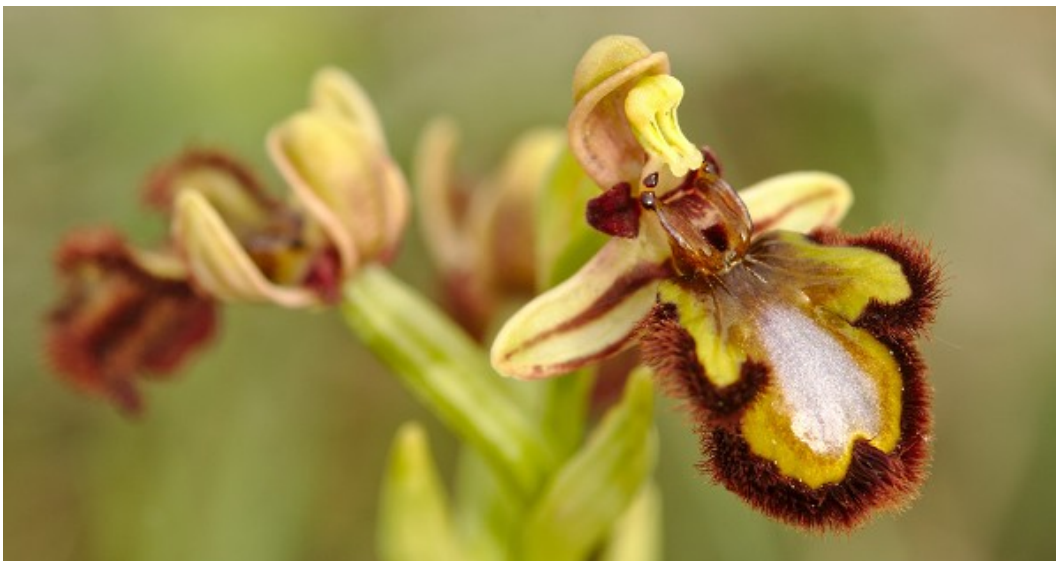
Figura 4: Ophrys speculum , una espècie que aquest any s'ha retrobat a diversos llocs d'Osona.