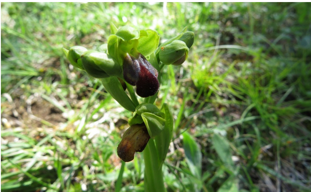
Figura 1: Ophrys sulcata , espècie trobada per primer cop aquest any a Osona.

Per últim, aquest any s'ha acabat de posar a punt el mapa interactiu i ja és consultable on-line, a l'adreça http://mapa-orquidies.gno.cat . Aquest mapa, que permet consultar la distribució de cada tàxon a Osona en quadrícules de 5x5 km i el nombre de citacions i tàxons per quadrícula, s'ha actualitzat dos cops aquest any, a l'agost i al desembre.